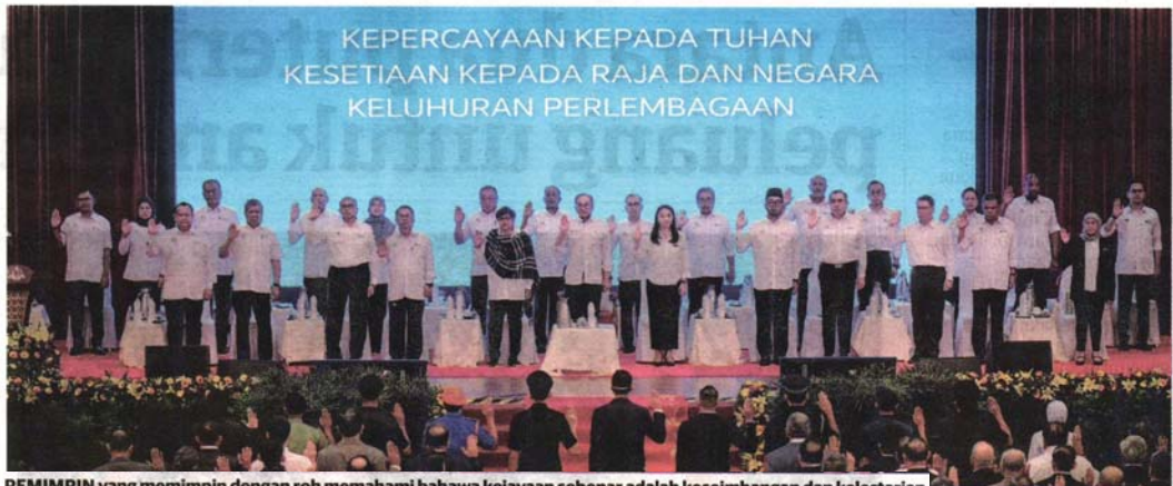
PEMIMPIN yang memimpin dengan roh memahami bahawa kejayaan sebenar adalah keseimbangan dan kelestarian.

Memimpin dengan roh bukanlah satu konsep abstrak atau retorik spiritual semata-mata. Ia adalah pendekatan kepimpinan yang berakar pada kesedaran bahawa setiap tindakan mempunyai implikasi moral dan