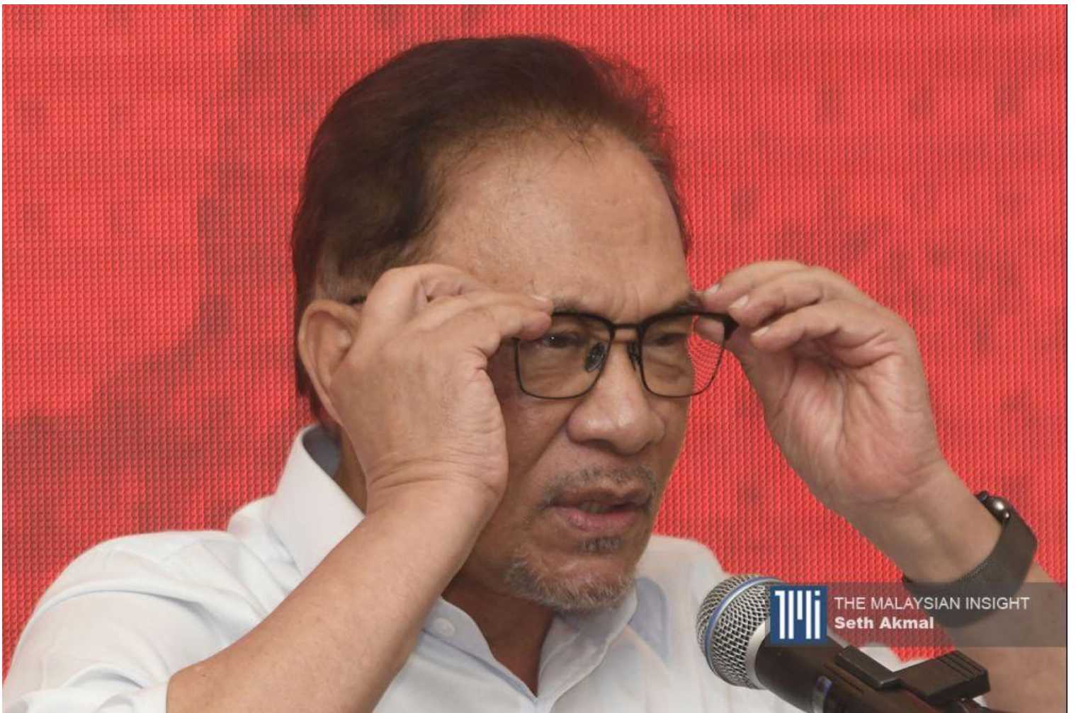
安华依然是公正党的象征，党员对他有深厚的感情。