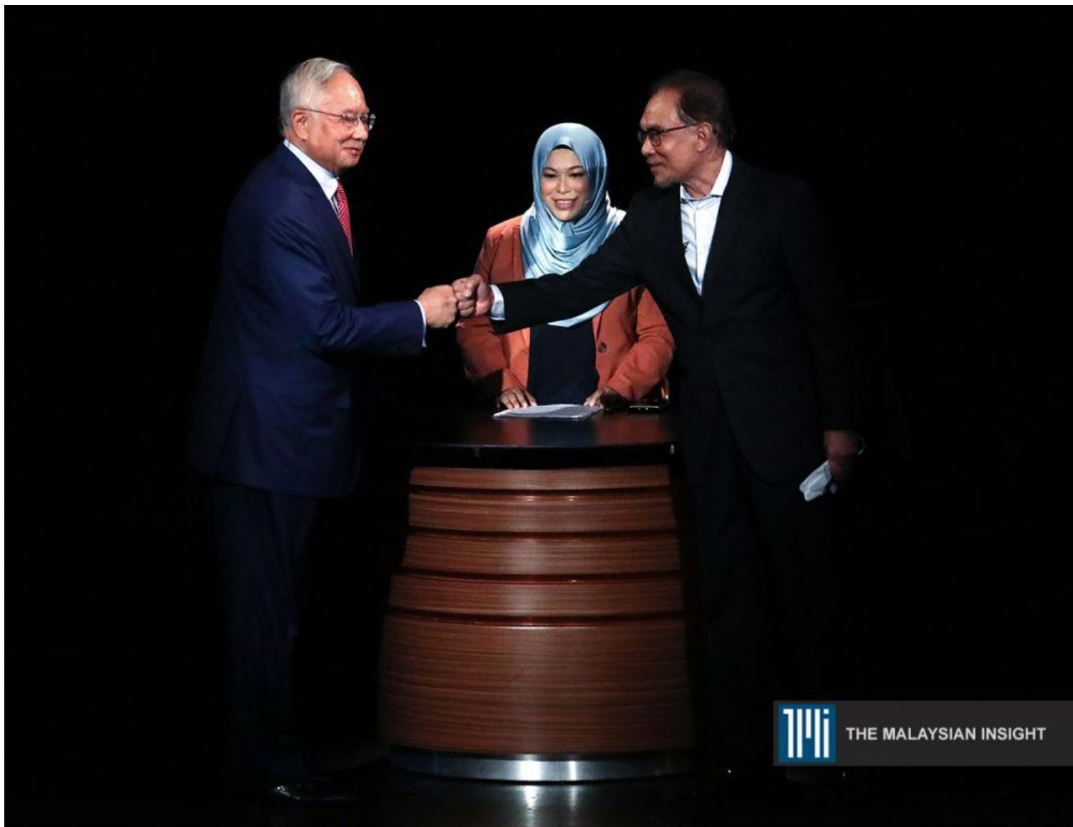
安华和纳吉在5月12日，针对沙布拉能源课题（Sapura Energy）和马来西亚的未来辩论。

前首相纳吉与国会反对党领袖安华的辩论已经过去一周，我相信不少人已评论过，让我带你从不一样的角度来了解辩论中直接或间接的政治经济学观点。