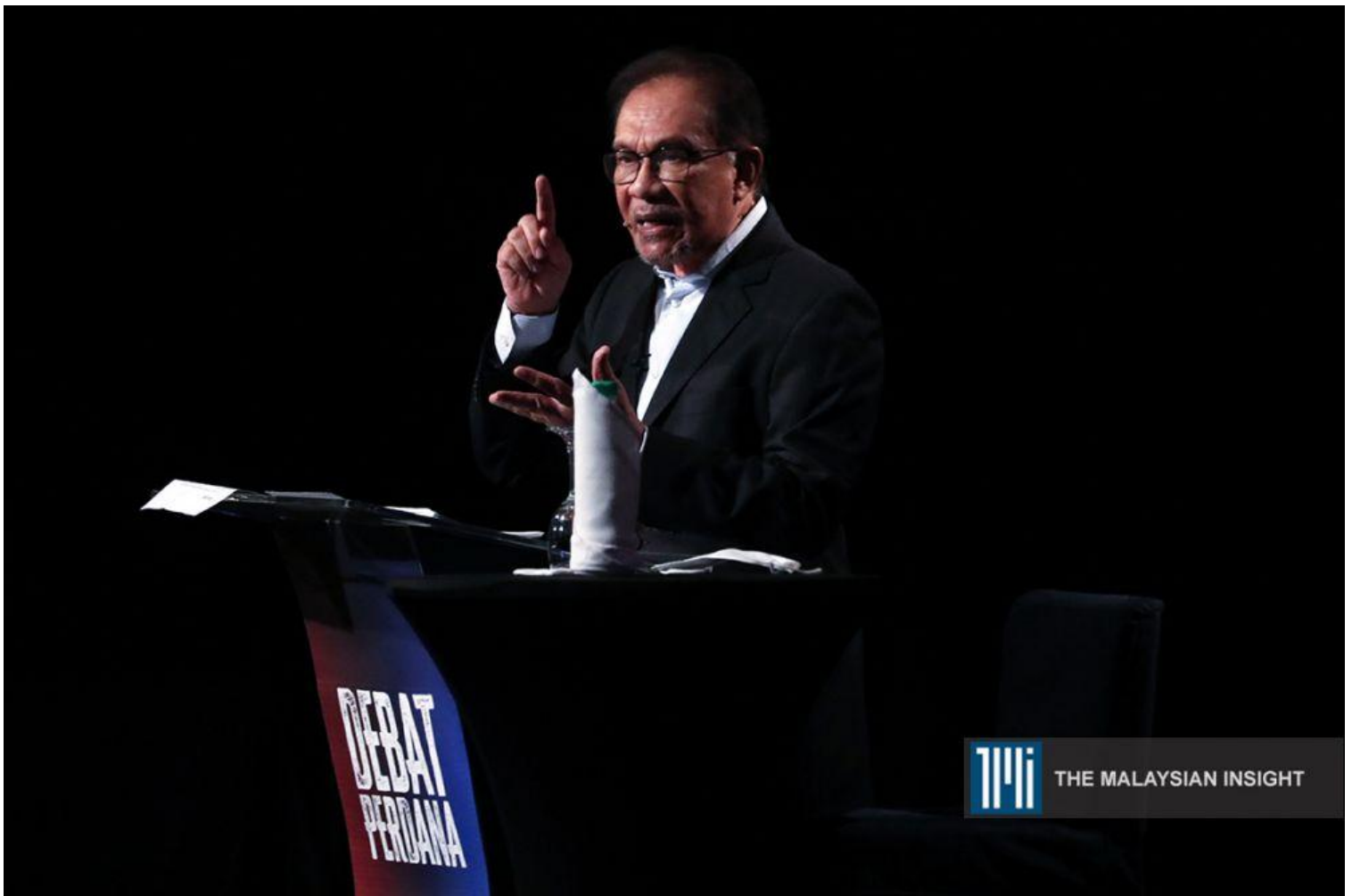
安华主张为全体马来西亚人提供针对性不强，但更全面的减税。