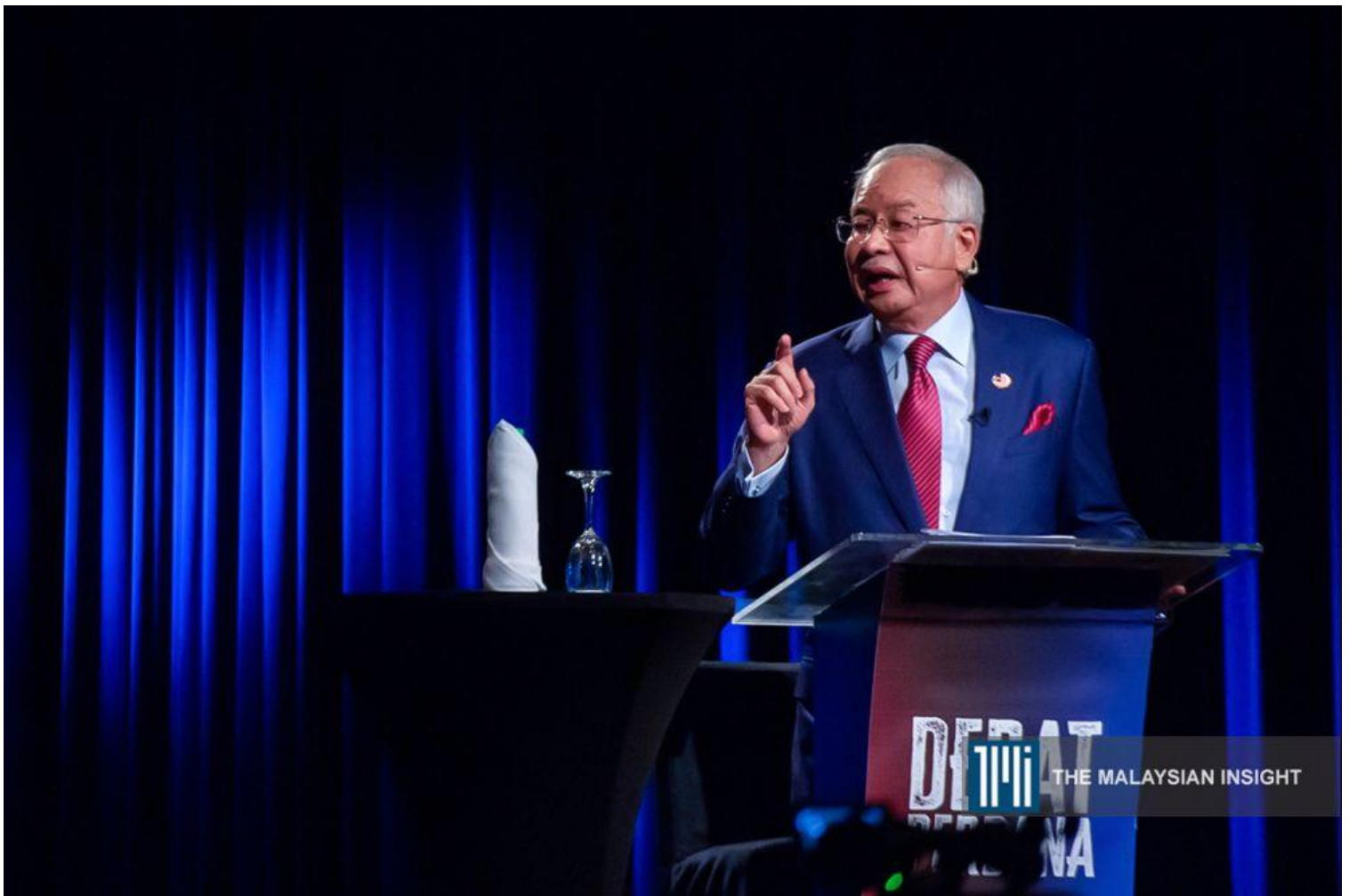
纳吉在辩论中提出的经济哲理是根据消费情况来对每个人平等征税，然后通过税收以现金方式派发给B40家庭。档案照：透视大马)