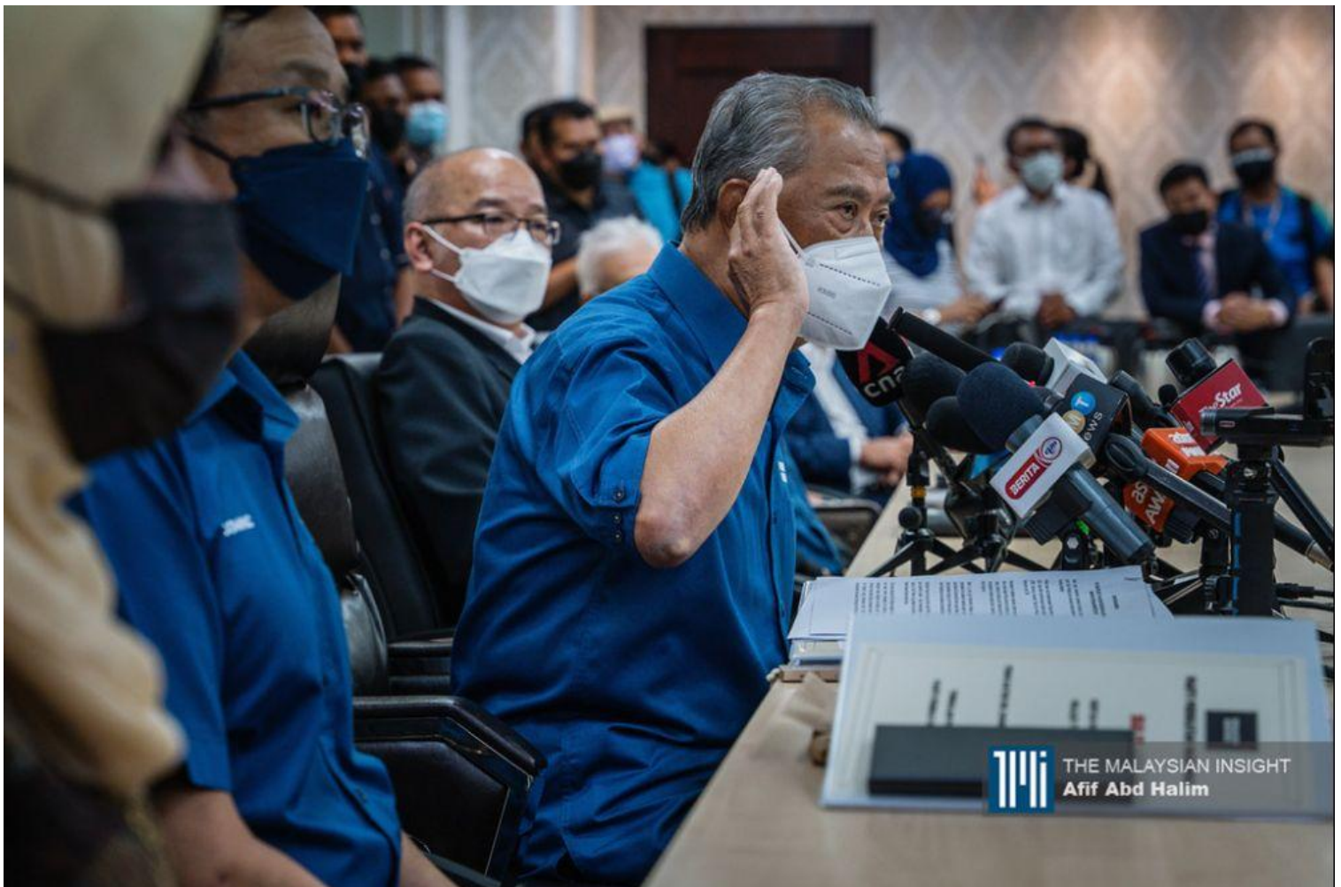
在大帐篷下，国盟是否会同意只竞选上届大选赢得的13个议席？

我不是尝试说服慕尤丁或马哈迪是一个值得信赖的人，而是认清今时今日的政治现实。今天反对党的政治格局和2018年的大选已有所不同。我们必须接受现实与事实，那就是难以复制2018年的选举表现，甚至会回到2008年前的政治格局。