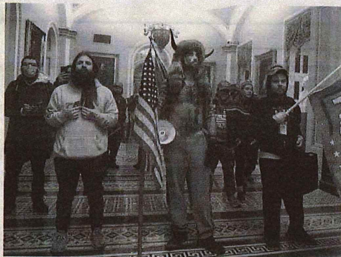
PARA penyokong Donald Trump menyerbu dan merusuh di bangunan Capitol, Washington, Amerika Syarikat pada 6 Januari lalu.