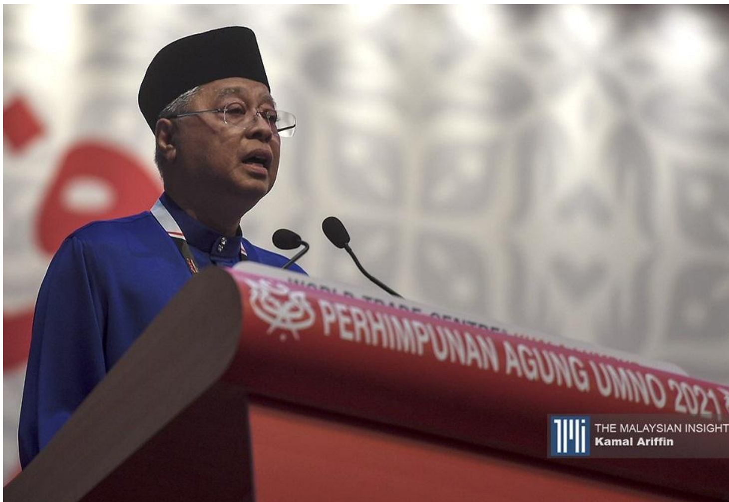
柔佛州选为例，特别是宣布胜利时，他没有得到内阁首长的礼遇，支持者也不给他脸，直接高呼“解散国会”。

第二，他可以撑过巫统领袖和党员给他的压力吗？以柔佛州选为例，特别是宣布胜利时，他没有得到内阁首长的礼遇，支持者也不给他脸，直接高呼“解散国会”。但是不要忘记，我在文章提过，建议解散国会权力只在他一人手里。