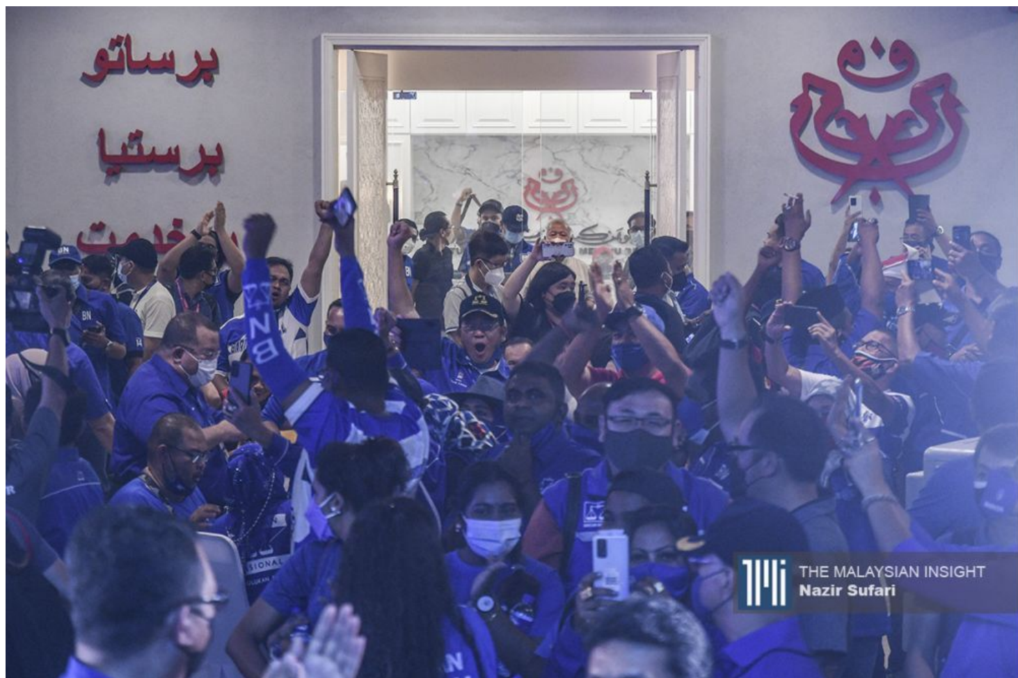
国阵胜出的州席中，部分议席的得票高于全部非国阵政党的总数。

抛开2018年全国大选，你会发现这一次2022年柔佛州选举并不令人惊讶。在2013年，反对党赢得18个州席，2008年，只赢得6个州席。今天，我会根据各政党的表现来讨论。