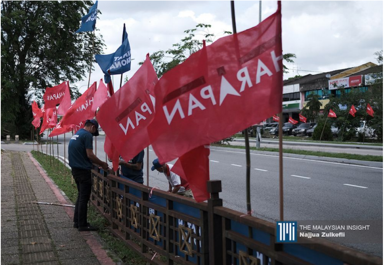
如果连大帐篷概念都无法实现，经历马六甲和柔佛州选后，反对党或许无法走的更远。

我认为这两个政党的唯一生存方式就是考虑一下“大帐篷”或类似概念。当然，在这种糟糕选举成绩之下，它们不可能获得像希盟成员党一样的分配。说的难听一点，根本没有谈判的筹码来与希盟谈判，倘若它们的要求不过分的话，希盟还可以考虑看看。