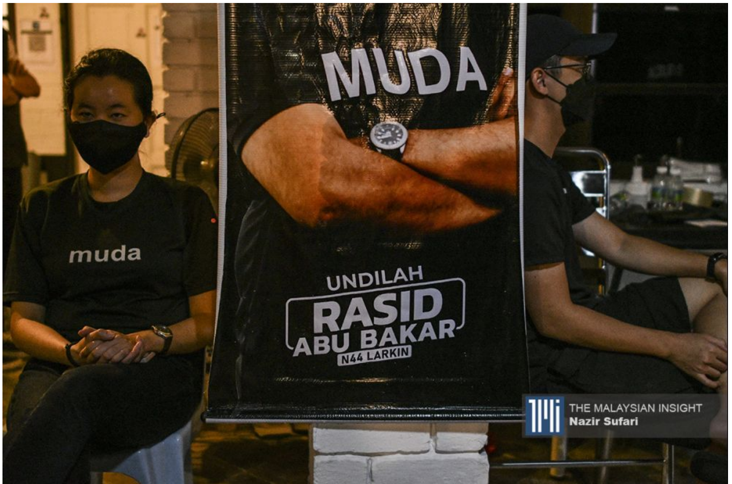
从选举成绩来看，MUDA最多是争取到希盟支持者的选票。