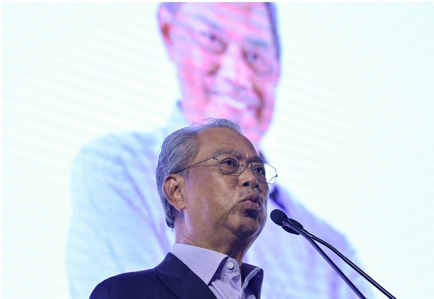
土团党即使官拜首相，在第15届全国大选也不会扮演举足轻重的影响力，因为国会结束，那你当官的任期也随着结束。

我所谓的‘接受’是在公平原则下的接受，而不是表面上的接受。虽然我对土团党在下届大选并没有抱任何希望，可是我相信土团党还是可以赢得一些议席。但是所赢得的这些议席并不是因为该党的贡献，而是来自巫统和伊斯兰党的支持者投于土团党。