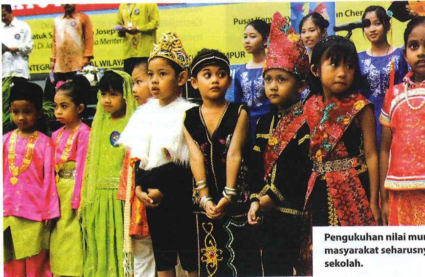
Pengukuhan nilai murni dalam kalangan masyarakat seharusnya bermula pada peringkat sekolah.

Hari ini, kita sibuk membawa pelajar sekolah rendah mahupun menengah ke