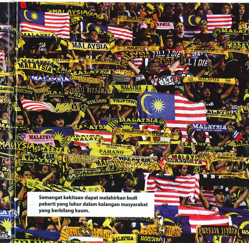
Semangat kekitaan dapat melahirkan budi pekerti yang luhur dalam kalangan masyarakat yang berbilang kaum.

Kepesatan teknologi dan media sosial kini merancakkan lagi gejala tidak berakhlak terutamanya bagi golongan belia. Hal ini dikatakan demikian kerana golongan belia kini merupakan pengguna tegar media sosial seperti