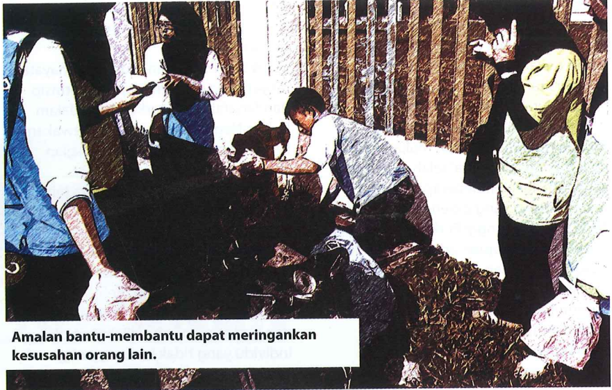
Amalan bantu-membantu dapat meringankan kesusahan orang lain.

Pada ketika itu, bermulalah jaguh siber yang tidak langsung mengenali latar belakang si mangsa, meninggalkan komen yang berunsur kecaman dan ugutan dalam media sosial. Oleh sebab itu, hal inilah antara kerancuan atau kelompangan nilai kesopanan dan kesusilaan yang berlaku dalam kalangan masyarakat Malaysia. Di manakah letaknya nilai dan adab "menjaga air muka" yang sudah berkurun dididik oleh orang tua kita? Malah, dalam semua agama juga menitikberatkan isu yang melibatkan etika ini. Kesannya, bukan sahaja menampakkan sikap sebenar rakyat di negara ini, malah meninggalkan kesan yang mendalam terhadap mental dan emosi si mangsa. Bertambah parah lagi, kira-kira satu pertiga penduduk di negara ini mengalami penyakit kemurungan seumur hidup berdasarkan statistik Kajian Kesihatan Morbiditi Kebangsaan