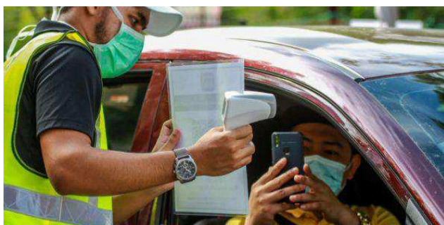
Daftar penuntut USIM secara pandu lalu