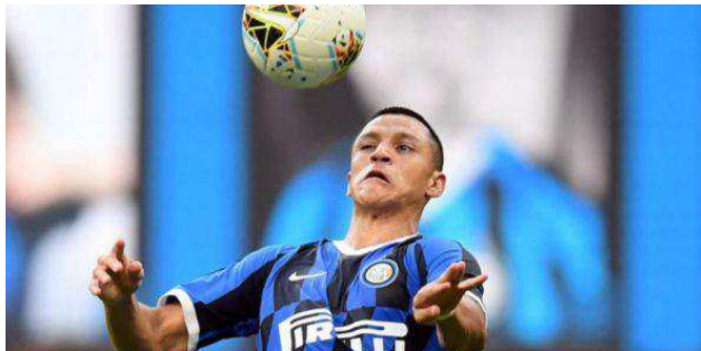
Sanchez sah kekal di Inter Milan