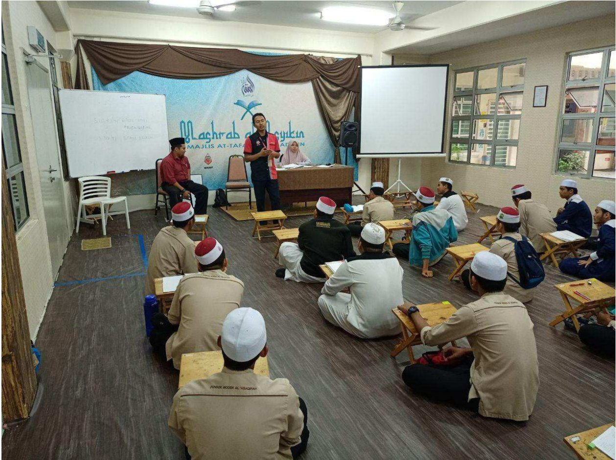
SUASANA pembelajaran di Pondok Moden Al-'Abaqirah di Kuala Lumpur yang diharap dapat melahirkan ulama Islam dalam pelbagai disiplin ilmu. – GAMBAR HIASAN