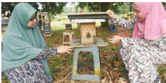
Madu kelulut mampu cegah kencing manis