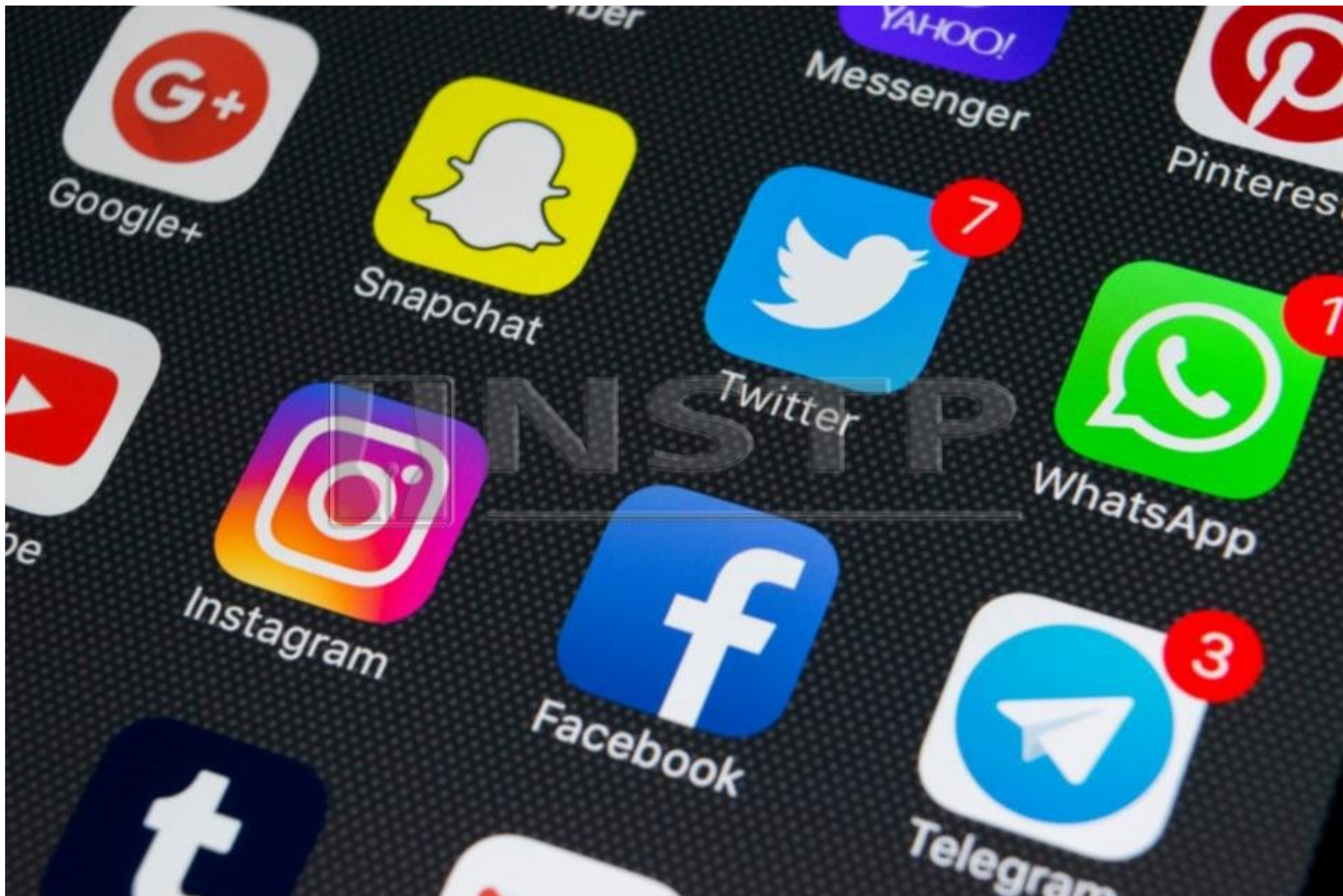
MEDIA sosial juga berperanan menjadikan masyarakat Malaysia lebih peka kepada keadaan sekeliling dan mengeratkan hubungan sesama individu. - Foto hiasan