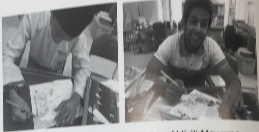
Gambar 2 : Peserta Kajian Melakukan Aktiviti Mewarna

yang bertalian, untuk menjalankan aktiviti mewarna tersebut dengan guru turut terlibat sebagai pemantau (Gambar 2)