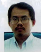
Lulusan B.IRKH, Universiti Islam Antarabangsa Malaysia (UIAM) dan Sarjana dari Universiti Teknologi Mara (UiTM). Telah menyiapkan tesis PhD untuk Jabatan Pengajian Sains dan Teknologi, Universiti Malaya berkaitan dengan nilai-nilai Islam dan ICT. Kini berkhidmat di Kulliyah ICT, UIAM. E-mel: anzansz@gmail.com

Seharusnya, ICT digunakan untuk menegakkan syariat Allah s.w.t. dengan membantu mencapai tujuan dan maksud syariah itu sendiri. Melihat kepada peranan ICT dalam kehidupan manusia hari ini, roh pembangunan dan penggunaan ICT yang berpaksikan tauhid dan berpandukan syariah harus dihidupkan dalam jiwa dan sanubari setiap pengamal dan pengguna ICT. Ia digerakkan oleh niat untuk mentaati Allah dalam semua aspek kehidupan yang moden ini dengan menggunakan teknologi yang ada bagi membina kehidupan manusia berlandaskan syariat. S