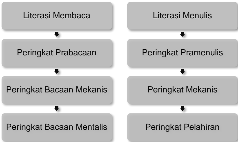
Rajah 3.1: Literasi Membaca dan Menulis

Seterusnya, model literasi juga dapat dikuasai secara tidak langsung melalui aktiviti perbualan dengan kanak-kanak dan rutin harian pembacaan buku serta penulisan bersama kanak-kanak yang dirancang dengan baik. Jika semua pihak, iaitu guru-guru, ibu bapa dan kanak-kanak sendiri memberikan sokongan dan persekitaran yang kondusif terhadap perkembangan literasi, maka proses perkembangan literasi akan berlaku secara berterusan dengan pesat. Oleh yang demikian, perkara ini perlu diberi perhatian oleh para pendidik di Malaysia agar pengajaran dan pembelajaran literasi kanak-kanak berada pada paras yang optimum. Sehubungan itu, perbincangan dalam bab ini menjurus kepada literasi membaca dan menulis dan huraianya seperti dalam Rajah 3.1.