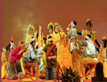
Persembahan Ulek Mayang

Warisan Melayu merupakan himpunan nilai-nilai budaya dan tradisional yang diwariskan daripada generasi ke generasi. Warisan yang diwarisi ini mencerminkan cara hidup masyarakat seterusnya membentuk identiti dalam masyarakat. Tarian, muzik, pakaian, adat istiadat dan bahasa antara warisan Melayu yang diwarisi hingga kini.