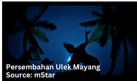
Persembahan Ulek Mayang

Ulek bermaksud meracik atau mengulek manakala Mayang merujuk kepada mayang pinang (bunga untuk pokok pinang) yang digunakan dalam tarian Ulek Mayang. Gerak tari yang halus, penggunaan busana tradisional Melayu seperti baju kurung atau baju kebaya di samping diiringi oleh alat musik tradisional seperti gendang, gong dan serunai menonjolkan keunikan warisan Melayu ini.