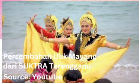
Persembahan Ulek Mayang dari SUKTRA Terengganu