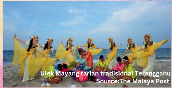
Ulek Mayang tarian tradisional Terengganu

Mendengar akan rayuan tersebut Puteri Sulung memerintahkan agar pertarungan itu dihentikan.