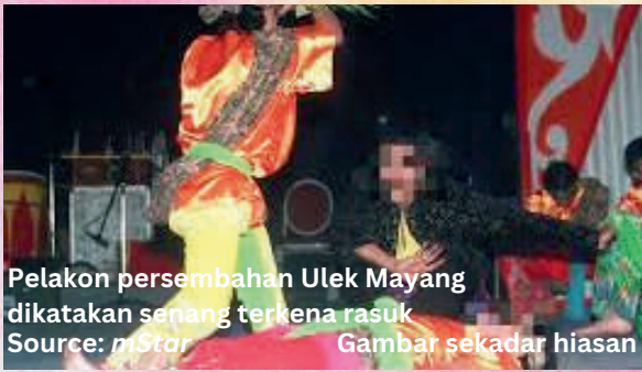
Pelakon persembahan Ulek Mayang dikatakan senang terkena rasuk Gambar sekadar hiasan