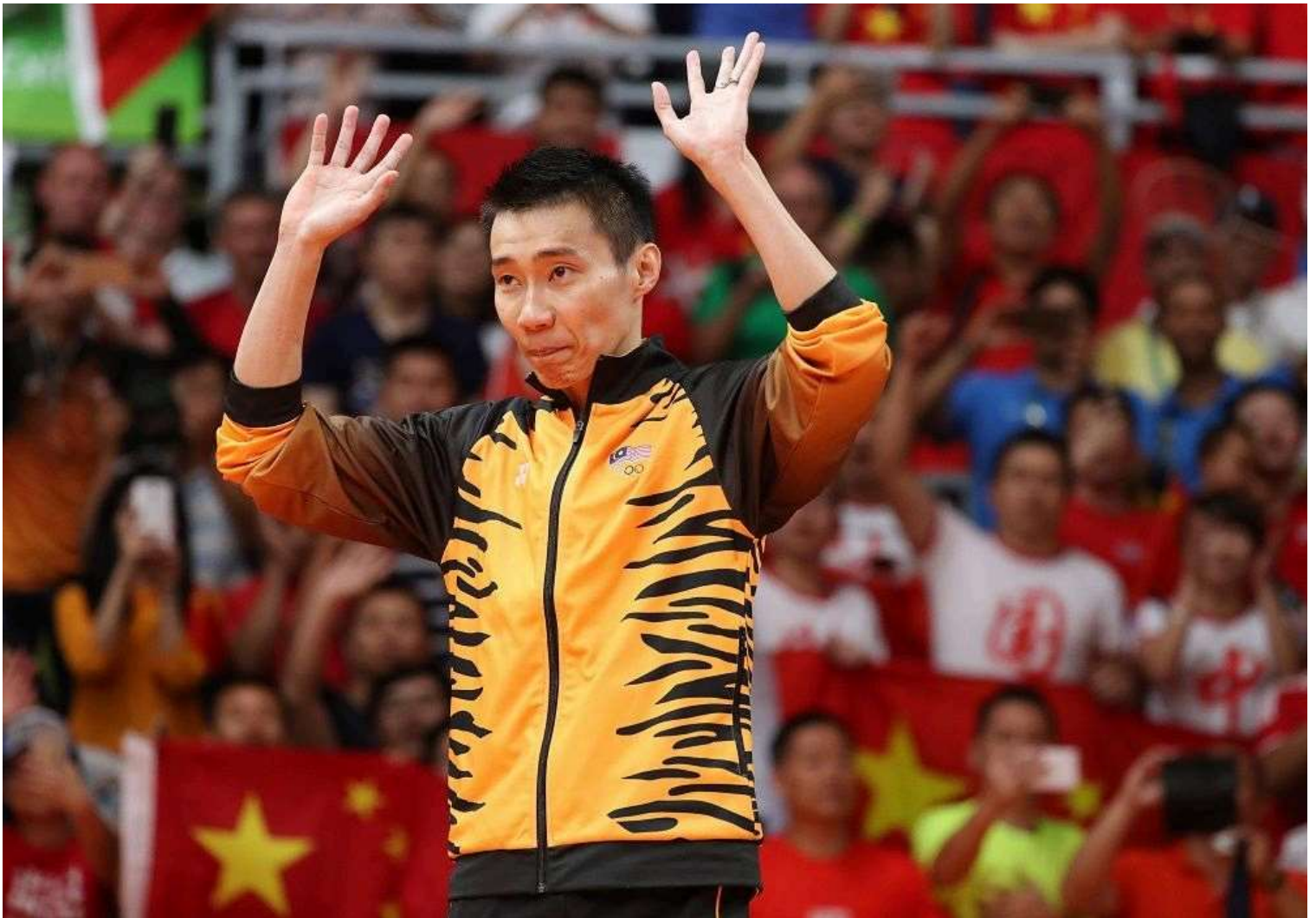
民众会质疑的可能是李宗伟是否有辩论公共政策的能力，以及是否了解制定国家法律等等。

最后更新11个月前 · 刊登于15 Jun 2023 2:21PM · 0条评论