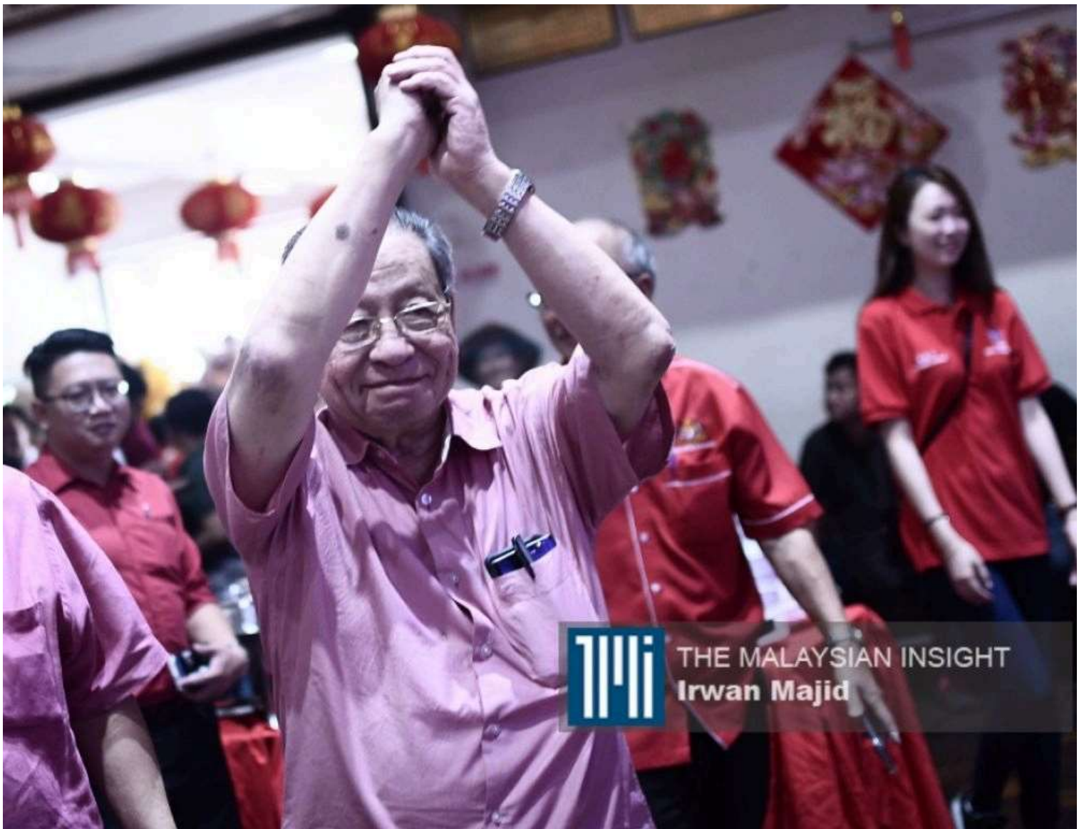
配合国家元首苏丹阿都拉陛下诞辰，民主行动党元老林吉祥获得封赐，受封丹斯里勋衔，这是陛下的决定。