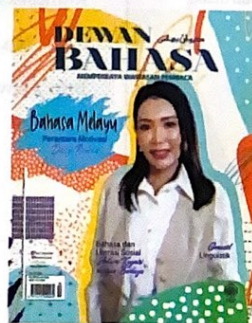
Konsep, Penata Gaya dan Pengarah Seni @roslimn Lokasi Rimbun Gasing

44 ANTARABANGSA Genosid Linguistik Zulkifli Salleh