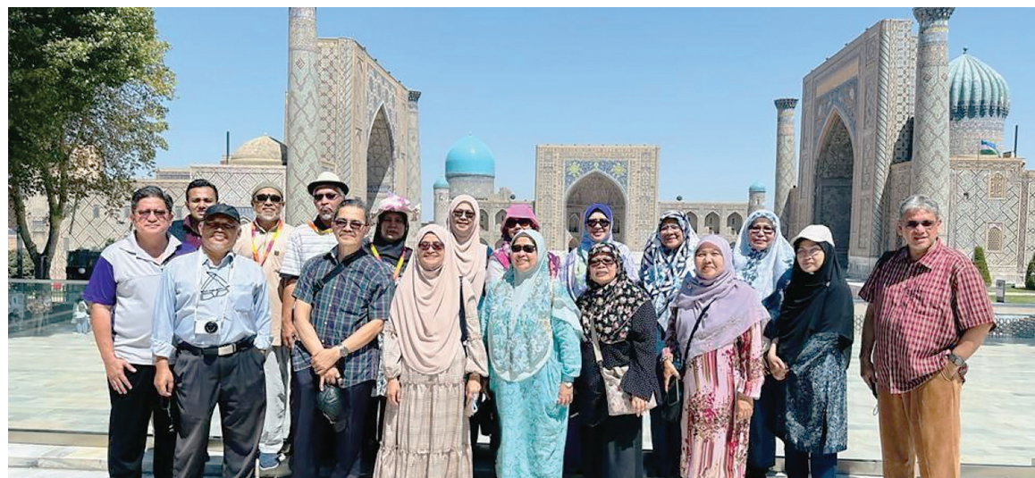
MERAKAM kenangan di Registan Square.

Kunjungan ke makam Qutham Bin Al-Abbas R.A, sepupu baginda Rasulullah, memberikan kesan mendalam kepada kami. Sahabat Nabi ini sanggup meninggalkan tanah kelahiran demi menyebarkan dakwah Islam melalui laluan sutera yang tandus dan mencabar. Qutham disemadikan di kota bersejarah, Samarkand.