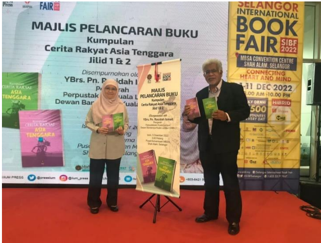
Gambar 2: Majlis Pelancaran Buku Kumpulan Cerita Rakyat Asia Tenggara Jilid I dan II di Pesta Buku Antarabangsa Selangor.