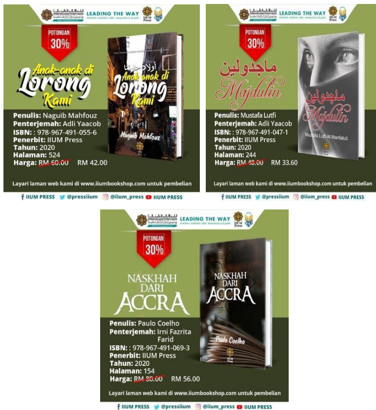
Gambar 8, 9 dan 10: Promosi tiga buah buku terjemahan terbitan IUM Press