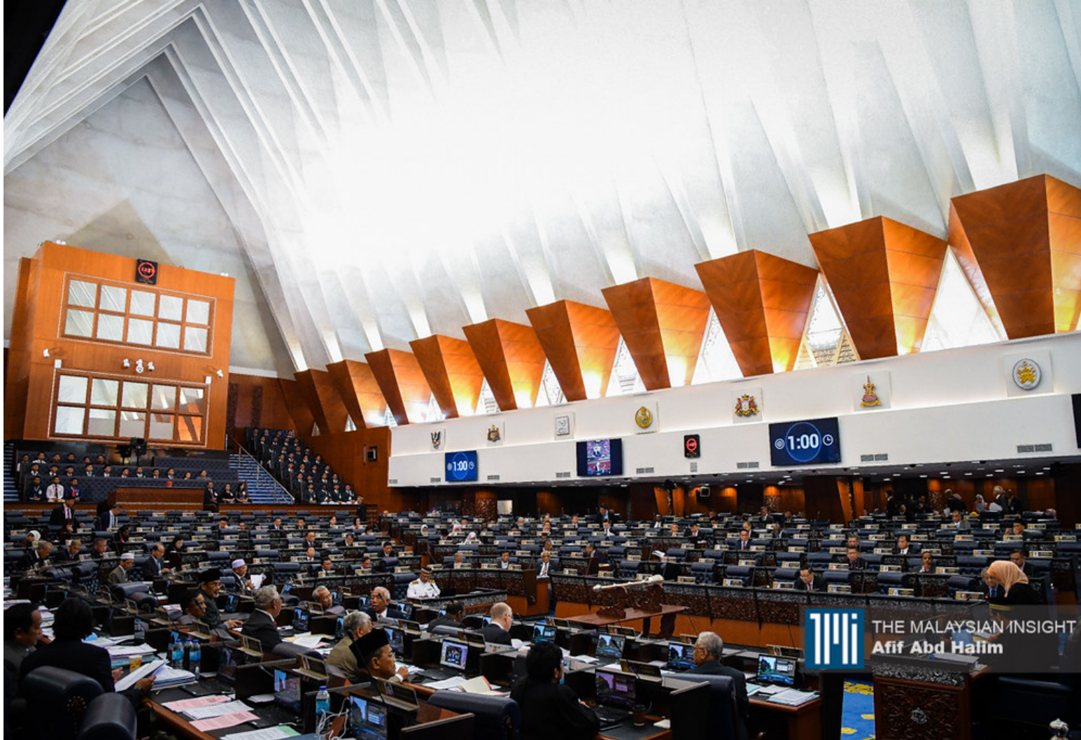
笔者对新法案中保留将废除第48 (6) 条文，即禁止辞职国会议员竞选5年感到欣慰。

首先，我对新法案中保留将废除第48 (6) 条文，即禁止辞职国会议员竞选5年感到欣慰。