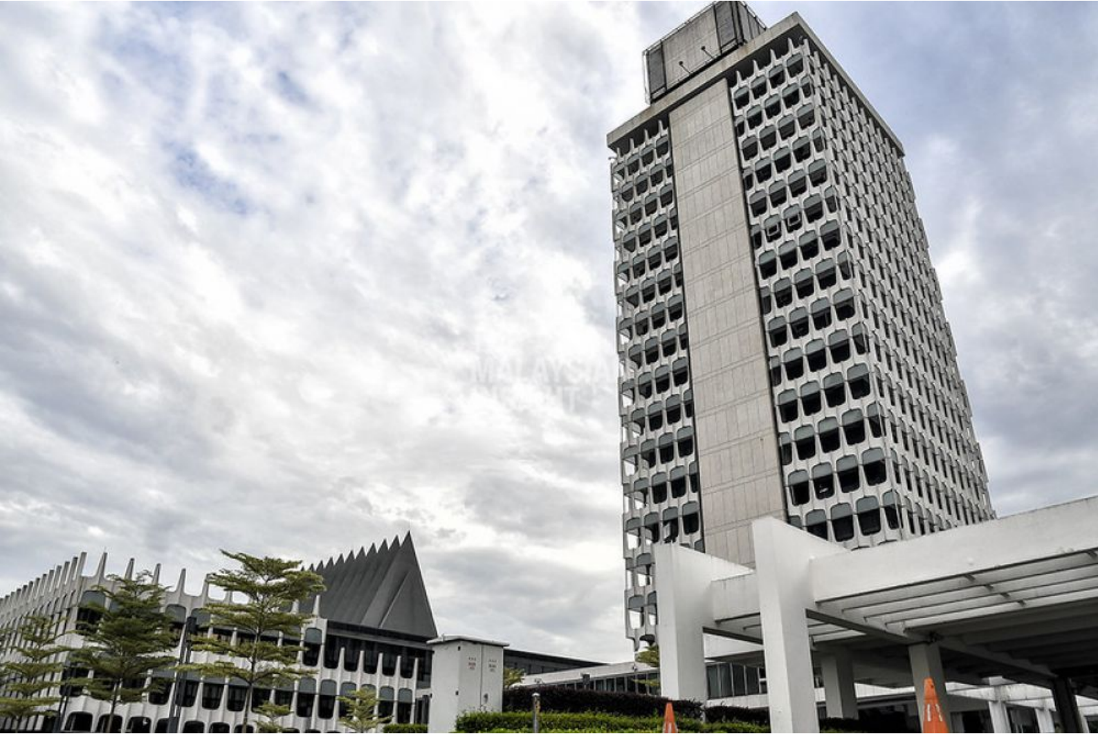
新版反跳槽法案比之前版本糟糕，因为忽略选民的投票意向。

民主是一种模式，其本身面临许多内部矛盾的问题，然而，对我来说，民主的基本原则是人民的意愿。一个民主国家，宪法和法律是保障人民权力的工具，并不是相抵触。