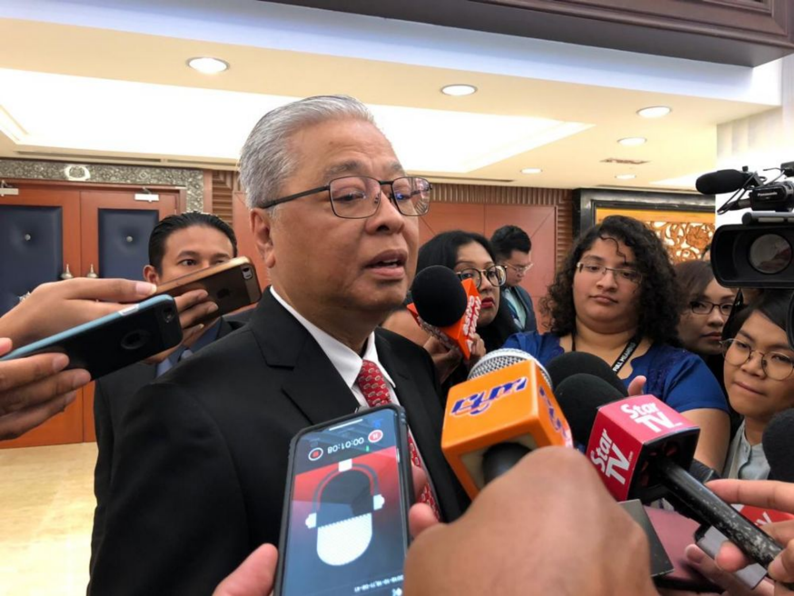
伊斯迈沙比里说，未发生的事情不予评论。（danganz：透视大马）

更何况，在这几天里，我们也没什么看到有来自巫统的人大力反对阿末扎希的做法。冒昧的说，你可以形容阿末扎希是专制，控制整个巫统，或比较客气的说法是，巫统党员和领袖都和阿末扎希站在一起。不管怎么说，巫统最高理事还是在阿末扎希的影响圈内，所以他可以为所欲为，毕竟下一次党选必须在第15届大选之后。这也说明有没有得在大选党候选人，还是阿末扎希说的算。