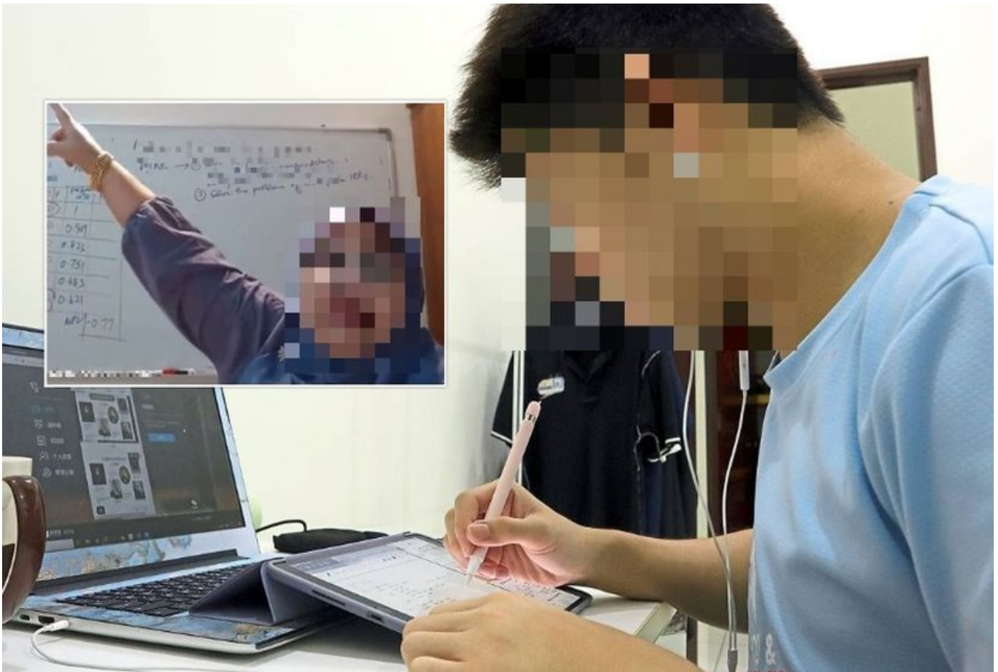
VIDEO tular pemsarah menghina golongan B40 merupakan antara kandungan negatif yang menjadi pilihan netizen. — Gambar hiasan

KEBELAKANGAN ini, kita sering melihat semakin banyak paparan video yang mengundang tidak senang hati atau kebencian menjadi tular terutamanya di media sosial di Malaysia. Sebagai contoh, antara rakaman yang tular adalah paparan video seorang individu memarahi pekerja kedai serbaneka apabila anaknya dituduh mencuri, paparan video seorang selebriti yang menonjolkan satu